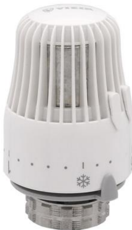
Термоголовка жидкостная с ограничителями VF.4000.0.0