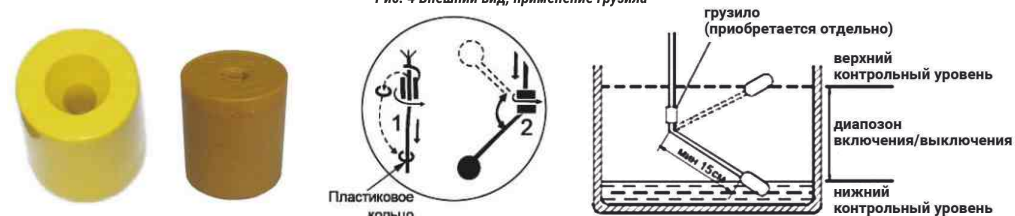
Рис. 4 Внешний вид, применение грузила

Если в качестве регулятора верхнего и нижнего контрольного уровня воды предполагается использование грузила (приобретается отдельно), то его необходимо сначала надеть на кабель выключателя поплавкового. Для чего отделить от корпуса грузила соответствующее пластиковое кольцо и надеть его на кабель в месте предполагаемого размещения грузила. Затем надеть на кабель грузило стороной, имеющей коническое углубление. Придвинуть грузило к пластмассовому кольцу.